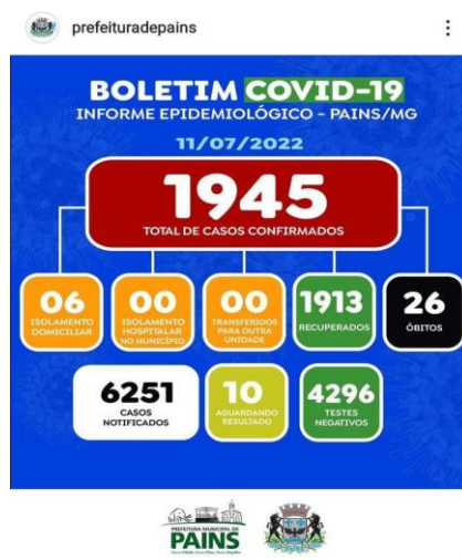
Figura 11- Boletim de casos de covid-19

As cidades gastaram suas verbas para auxiliar a sua população e conseguir resultados positivos para se recuperarem da covid-19.