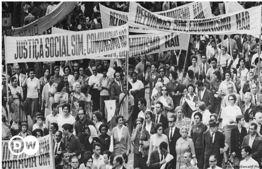
Figura 4- Manifestação contra a ditadura

O governo militar só começou a ter fim com a realização de inúmeras manifestações em massa nas principais cidades brasileiras, com a população pedindo a realização de eleições diretas, as manifestações ganharam o nome de direta- já. Também foi criado um movimento chamado frente ampla na tentativa de criar um projeto para enfrentar a ditadura militar, e criar uma democracia. O projeto foi feito pelos parlamentares Carlos Lacerda, Juscelino Kubitschek, João Goulart. (SILVA, 2022).