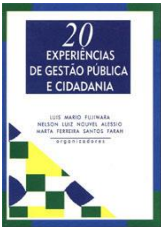
Figura 6 - Gestão e cidadania