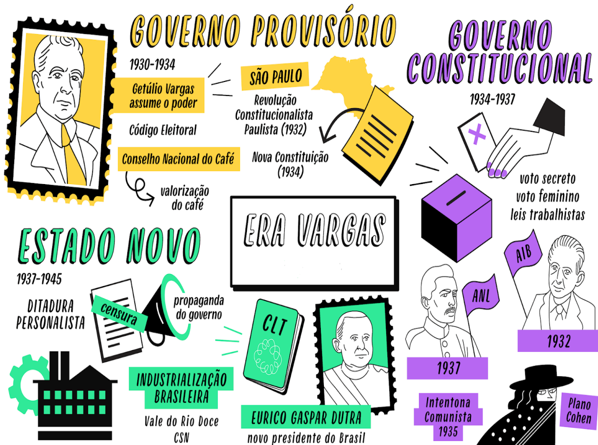
Figura 2 - Governo novo, era Vargas

Após o ano de 1930 a república velha foi substituída pelo estado novo, à era Vargas que teve duração por quinze anos e trouxe para o Brasil diversas transformações políticas, sociais, econômicas, culturais como, a implementação dos direitos trabalhistas, salário mínimo, carteira profissional, férias remuneradas, Vargas fez fortes investimentos nas áreas de infraestrutura para beneficiar o país como a criação da companhia vale do rio doce e hidrelétrica do vale do São Francisco (CAVALCANTI, 2022).