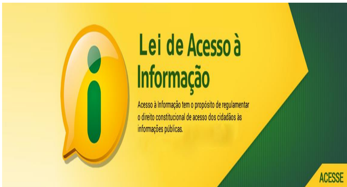
Figura 7- Acesso a informações

No ano de 2011 foi denominada a Lei 12.527, que dá a população o acesso a informações e procedimentos a serem seguidos pela união, estado, distrito federal e municípios, esta lei representou um grande passo para a consolidação da democracia no Brasil e ajudou para o fortalecimento das políticas de transparência pública, ela aborda como princípio fundamental o acesso a informação pública com prazos e procedimentos para a entrada de informações, para que os cidadãos possam tem acesso (BRASIL, 2020).