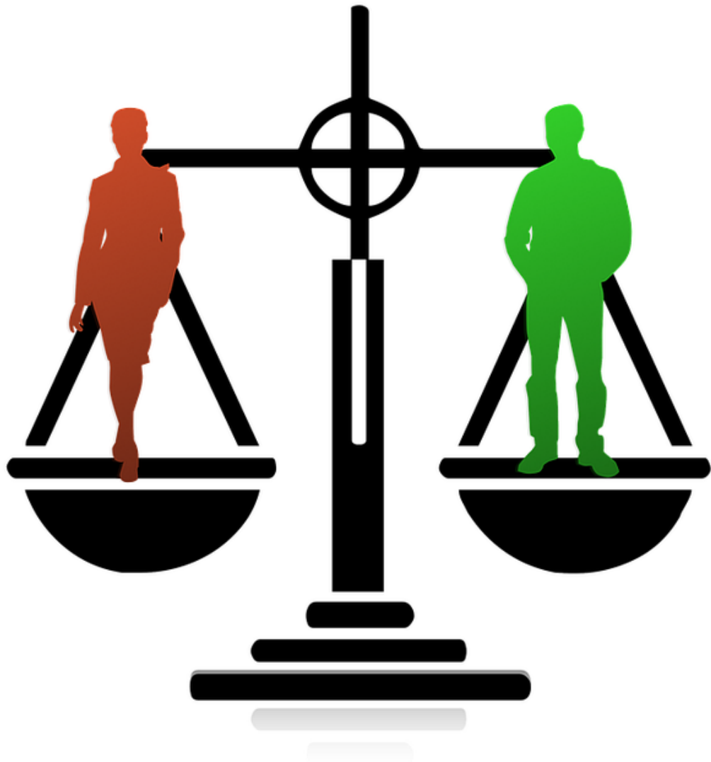
Figura 8- Igualdade política