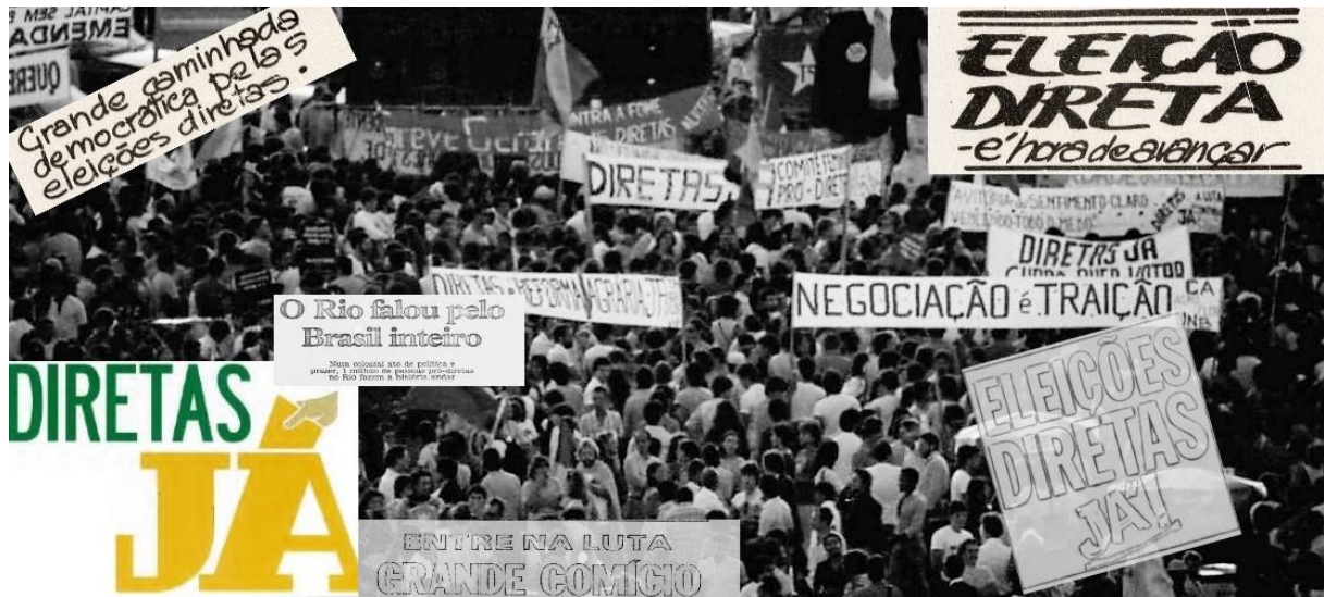
Figura 5- Manifestação para a democracia no país.