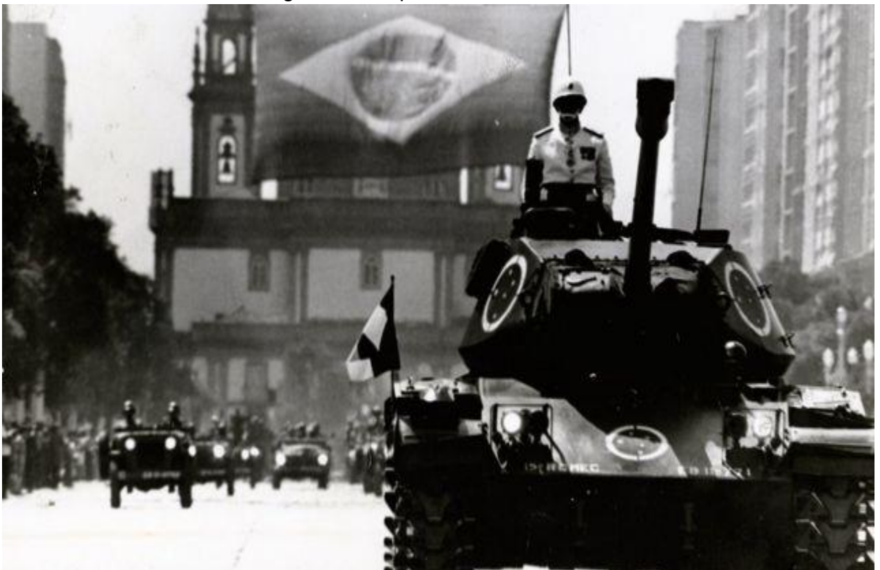
Figura 3 - Golpe militar de 1964

Em 1964 teve início a um golpe militar no Brasil após o governo do presidente João Goulart esse regime teve a duração de vinte e um anos, foram estabelecidos censura à imprensa, restrição aos direitos públicos, perseguição policial entre outros. O objetivo dessa revolta foi evitar o avanço das ações de João Goulart, durante a ditadura militar foi desenvolvida mais uma política no Brasil, a criação do ministério da desburocratização que veio com o intuito de diminuir o impacto da estrutura burocrática na economia do país. Nessa época o país teve um grande aumento econômico, industrial e agrícola, mas houve grande repressão no movimento dos trabalhadores, e os salários foram mantidos baixos porque a possibilidade de reivindicação era mínima (WOLTER, 2020).