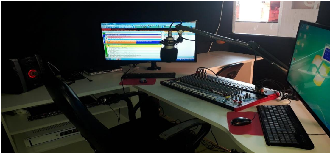
Figura 1 – Estúdio da Rádio Iguatama FM

No anexo A foram mostradas algumas imagens da estrutura da Associação Comunitária de Radiodifusão de Iguatama.