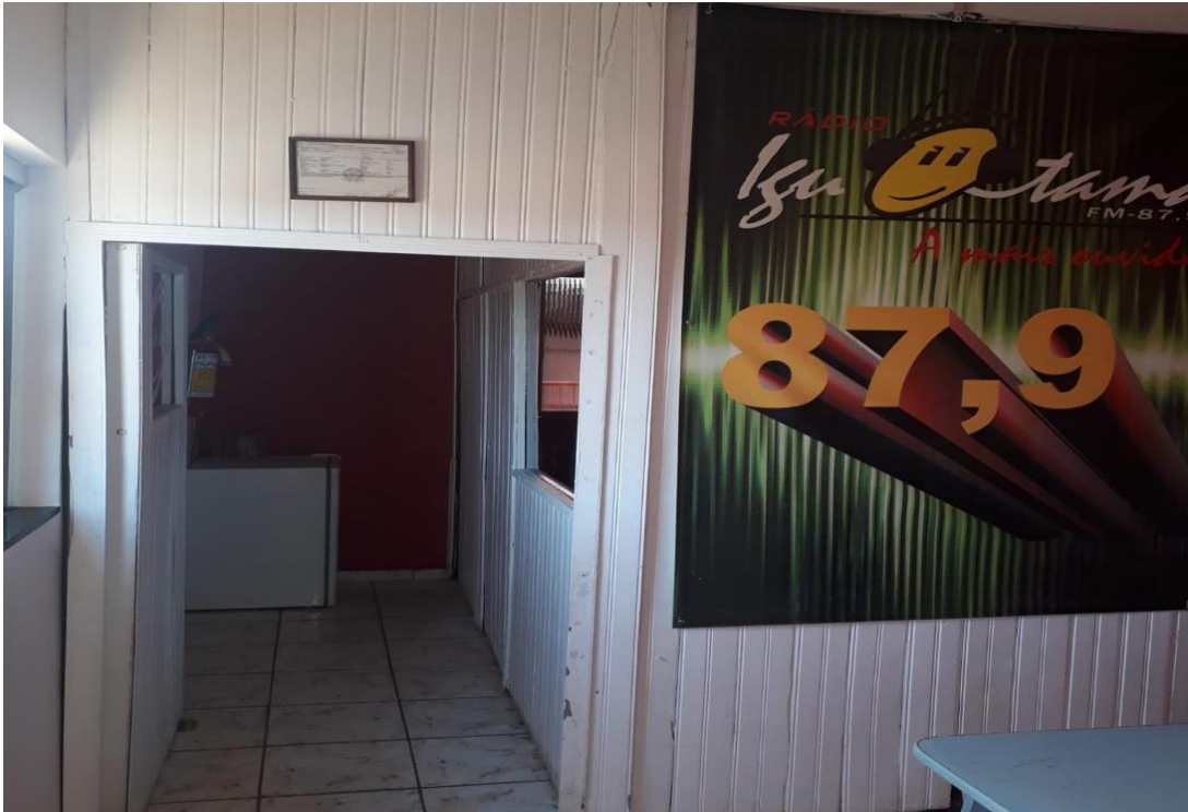
Figura 3 – Entrada da Rádio Iguatama FM