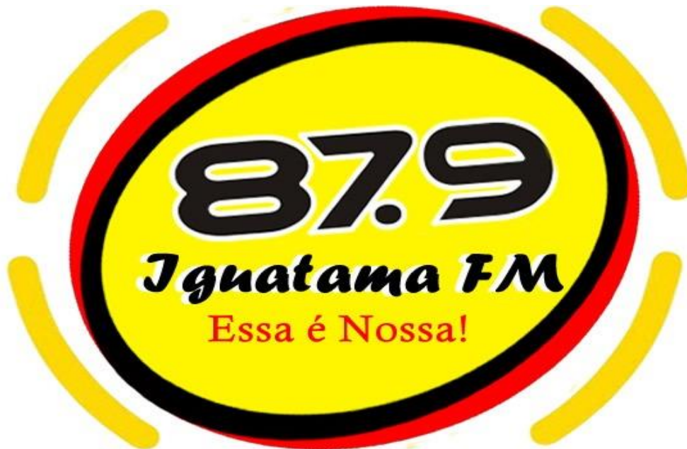
Figura 4 – Logomarca da Rádio Iguatama FM